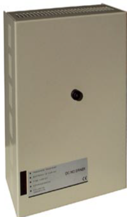
Рис.1 Внешний вид

ООО "Компания КИПА" Эксклюзивный дистрибьютер "Seitron s.r.l." в России г. Москва, ул. Приорова, д.2а тел/факс: (495) 450-28-37 тел.: (495) 782-99-87, 730-88-76, 450-68-24 450-16-81, 450-08-00, 450-10-41 http://www.seitron.ru e-mail: seitron@kipa.ru